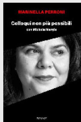
Marinella Perroni, Colloqui non più possibili con Michela Murgia , Piemme 2024, 115 pagine, 17,90 euro.